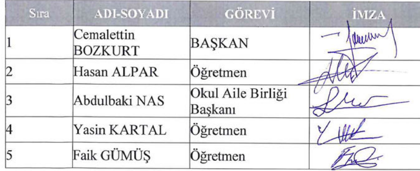
Tablo 25: Stratejik Plan Hazırlama Ekibi