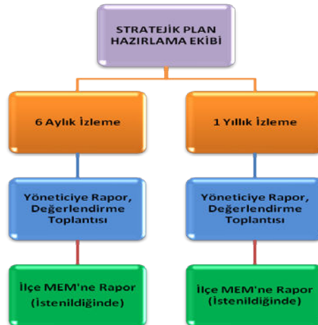
Şekil 2: İzleme ve Değerlendirme Süreci

Müdürlüğümüzün 2024-2028 Stratejik Planı İzleme ve Değerlendirme sürecini ifade eden İzleme ve Değerlendirme Modeli hazırlanmıştır. Müdürlüğümüzün Stratejik Plan İzleme-Değerlendirme çalışmaları eğitim-öğretim yılı çalışma takvimi de dikkate alınarak 6 aylık ve 1 yıllık sürelerde gerçekleştirilecektir. 6 aylık sürelerde Üst Yöneticiye rapor hazırlanacak ve değerlendirme toplantısı düzenlenecektir. İzleme-değerlendirme raporu, istenildiğinde Stratejik Geliştirme Başkanlığına gönderilecektir. Ayrıca ilimizin Mülki İdari Amirine sunulacaktır. 1 yıllık izleme-değerlendirme çalışmaları, Stratejik Planımızda yer alan hedeflerin yıllık düzeyde ifade edildiği Performans Programı ve yılsonunda gerçekleşme düzeylerinin belirlendiği Faaliyet Raporu hazırlanarak yapılacaktır. Performans Programı ve Faaliyet Raporu Üst Yöneticinin değerlendirmesinin akabinde Strateji Geliştirme Başkanlığına ve Mülki İdari Amire sunulacaktır. Yıllık izlemelerle ilgili değerlendirme toplantıları düzenlenecektir.